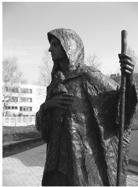
«Св. Ксения Петербургская»