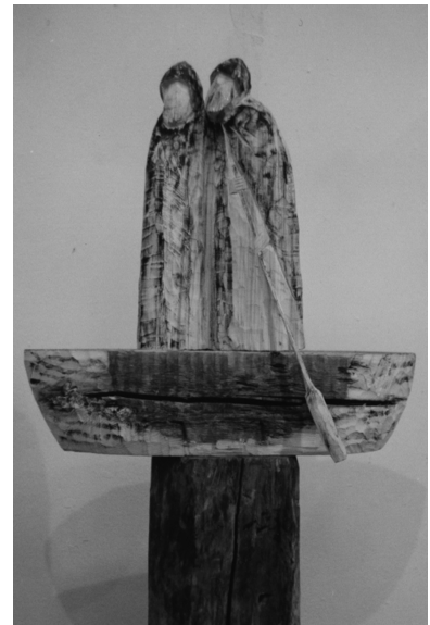
«Свв. Сергей и Герман Валаамские»

Образ – предупреждение – трубящий ангел Чернобыля (1986 г., дерево). (Интересно, что скульптор закончил создавать этого ангела накануне самой трагедии. Проникновенно нежный ангел, посвященный «юнкерам 1917 года» (2007 г., дерево, камень). Торжественно застыли в минуту молчания крылья Ангела «Памяти корабля “Лефорт”» (2005 г., дерево). Казалось бы источником этой мысли стал один и тот же образ, но их образы совершенно отличны; другие структуры композиций, пластика ангелов гибкая, чуткая, непосредственная по восприятию формы. Отдельными фигурами ангелов художник не ограничивается, они завершают многие композиции, обогащая их своим духовным светом.