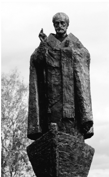
«Св. Николай Мирликийский»