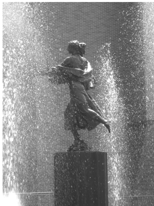
Чанчунь. Фонтан «Муза искусства»