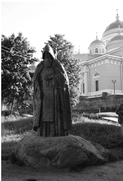
«Пр. Нил Столобенский»