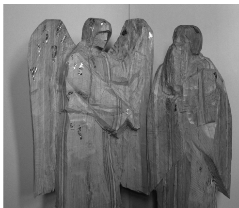
«Отцы пустынные. Пахомий Великий и Ангел»

Р.С. Уже после того, как статья о Б. Сергееве была закончена, скульптор вылепил и установил бронзовую фигуру летящей «Музы искусств» с лирой в руках, для большого фонтана. Живое мерцание статуи в динамических потоках воды воспринималось как пластическая поэма о духовной красоте человечества. Произведение создано в традициях русской монументально-декоративной скульптуры XIX–XX веков, но при этом созвучно современности. Возник интересный русско-китайский ансамбль. Фонтан органично вписан в «пространство» новой архитектуры самого крупного университета в Китае в городе Чанчунь.